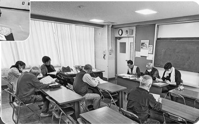
3/29国西分会《こんぴら橋会館》 仲間のつながりを強化するため 分会レクについて話し合った