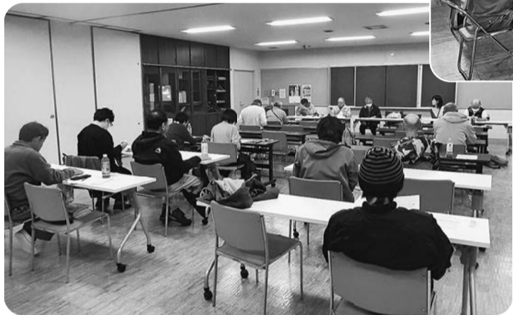
3/28国③分会《スポーツセンター》 2025年度のとりくみを 教訓に、新年度の分会 レクについて、活発な 意見が交わされた

2026年度分会総会を 3月26日から29日の日程 で全分会が開催しました。 事前に発送または手渡した 分会総会案内を行き渡ら せ、多くの仲間の出席を確 保するため、春一番拡大で の訪問行動などで参加を呼 びかけました。しかしなが ら、各分会とも出席者は少 人数で、人集めの基本であ る声掛けの徹底が各分会の 課題と言えます。 集まった仲間たちを前 に、各分会の新年度方針で は、仲間と仲間がつながる