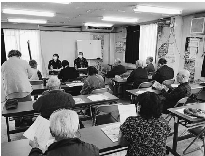
専門員による学習には多くの質問が出された

なが、同居している息子の収入も含まれるか」と切実な質問もありました。講師からは「本人と配偶者の世帯収入になる」と回答がありました。