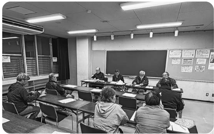
3/27小西分会《貫井センター》 20代事業主の出席もあり今後期待 住宅デーについても同会館開催を計画