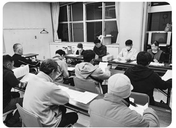
3/27国④分会《並木公民館》 群会議活性化を議論