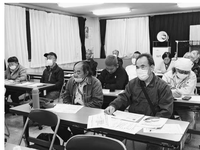
学習通じて命の危機を知る

3月24日(火)午後7時から、支部事務所において要求実現アクション2026の第一弾として、社会保障