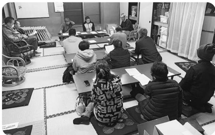
3/26前原分会《神明宮》 仲間の輪を広げ「賃上げ」や 「仲間増やし」すすめよう と話し合う