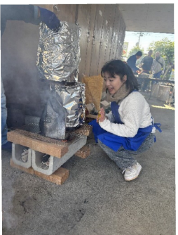
迫力のまぐろのカマ

12月7日(日)、支部にて朝から爽やかな冬晴れの中、待ちに待った餅つき祭のイベントに参加させて頂きました。毎年恒例の家族みんな大好きなイベントです。穏やかな雰囲気の中、たくさんの参加者でとても賑わっていました。