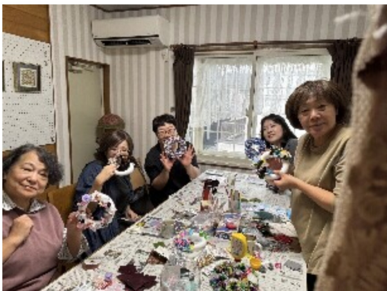
お喋りに花が咲く

10/16(木)の招き猫の活動は、布リース創りに挑戦！5cm角の布を台座に差し込むと云う比較的シンプルな作業だったので、お喋りにも花が咲き和やかに進行しました。各