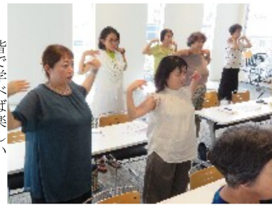
皆で学べば楽しい