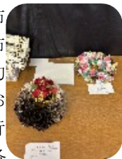
支部での作品展示

10/16(木)の招き猫の活動は、布リース創りに挑戦！5cm角の布を台座に差し込むと云う比較的シンプルな作業だったので、お喋りにも花が咲き和やかに進行しました。各