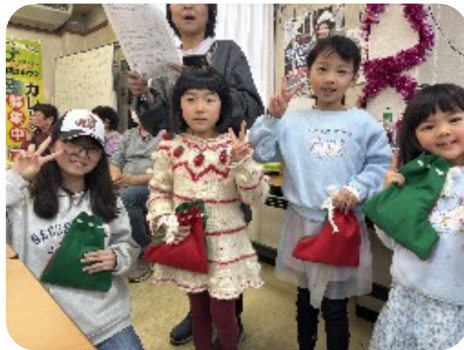
女の子たちには可愛いプレゼント

美味しいワインや高級山葡萄ジュース、そしてもちろん「さかみち」のケーキもあり、食べ切れない程のご馳走に、各テーブルの話も大いに弾みました。そして最後はお待ちかねビンゴ大会!今回は今までも増して豪華な景品がずらり。Redのブラシや、ロクシタンのハンドクリーム、高級洋菓子、ヨーグルトメーカー、イヤフォンなどを前に、可愛い助手さん二人の助けもあり大いに盛り上がりました。美味しいお料理と可愛いお嬢さん達とのやりとり、心温まるひと時を過ごすことが出来ました。