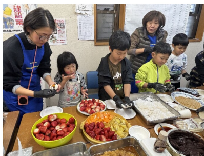
フルーツ大福を手作り

した。つきたてのお餅で子どもたちと一緒にイチゴや生クリーム、あんこなど色々なものをお餅で包んで大福を作っていました。柔らかくとても美味しかったです。