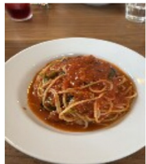
美味しいイタリアン

自持参した端切れやチャームで出来上がりは驚く程様々…。事務所の作品展に展示されていた物をご覧頂けた方もいらっしゃるかと思いますが、個性やセンスが光る素敵な作品たちは、創って楽しい！見て楽しい!!物となりました。