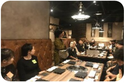
美味しい焼き肉を食べながら交流

10/9(木)に、立川の「焼肉いのうえ」で行われた後継者交流会に参加させて頂きました。普段は中々交流する機会のない多摩西ブロックの皆様と、後継者という同世代ならではの視点で意見交換ができた事は、私にとって