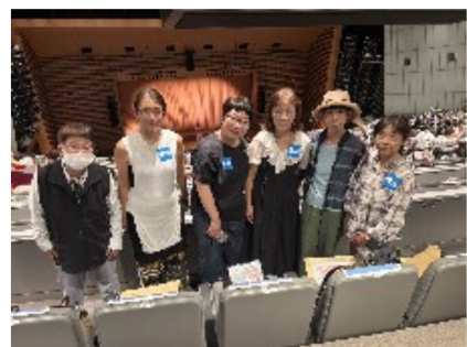
笑顔いっぱい参加

労働組合の団結力でいろいろな事が改善されたこと、地道な活動、諦めないで続けること、たくさん学びをありがとうございました。全員合唱「いまわたしは」 ♪今私達は生まれてくるあなたに私の愛おしい子供らにいのちの尊さを伝えます。命を生み出す母親私達のいのちを育て守ることを望みます。今私達は生まれてくるあなたと私達の尊さを伝えます。平和の尊さを伝えます。平和を育て生み出す母親や私達の平和を育て守ることを望みます。今私達