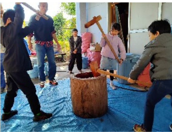
子供たちも頑張ってつきました!

12月7日(日)、支部にて朝から爽やかな冬晴れの中、待ちに待った餅つき祭のイベントに参加させて頂きました。毎年恒例の家族みんな大好きなイベントです。穏やかな雰囲気の中、たくさんの参加者でとても賑わっていました。